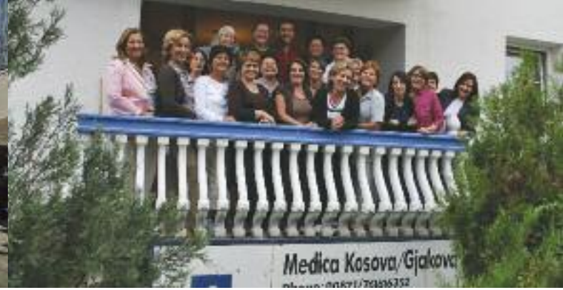
Das Team von Medica Kosova mit Monika Hauser im September 2009