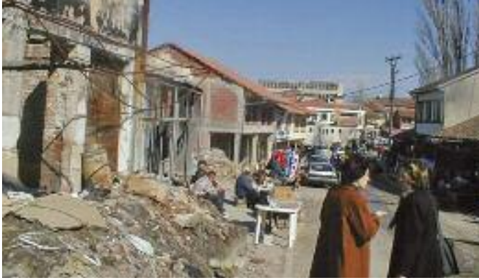
Die zerstörte Altstadt von Gjakova im Herbst 1999