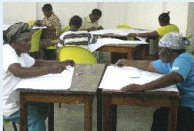
Am Ende des Trainings sammelten die Frauen Ideen, wie sie sich im Arbeitsalltag entlasten und besser für sich sorgen können.

Während des Trainings haben die Frauen einige Ideen entwickelt, wie sie zukünftig mehr auf sich achten wollen und auch, wie sie sich gegenseitig unterstützen können. So wollen sie zum Beispiel einen kleinen Raum im Frauenzentrum einrichten, wohin sich jede bei Bedarf zurückziehen kann. Regelmäßige Pausen in ihren Alltag einbauen und die Gesprächszeit mit Klientinnen strikt begrenzen, waren weitere Ideen. Außerdem wollen sie sich künftig Hilfe bei Kolleginnen holen, wenn sie beispielsweise ein schwieriges Gespräch mit einer Klientin haben. ■