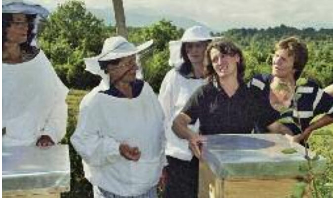
Mit der Honigproduktion erwirtschaften viele Frauen zum ersten Mal ein eigenes Einkommen.

„Wenn ich daran zurückdenke, wie verschlossen unsere Klientinnen in den ersten Nachkriegsjahren waren. Angesichts dessen sind die Erfolge unserer gemeinsamen Arbeit fantastisch. Sie haben mit der Landwirtschaft begonnen, sie erheben Anspruch auf ihren Platz in ihren Familien und Gemeinden und sie beginnen, diesen Platz ebenso im öffentlichen und politischen Leben einzufordern.“