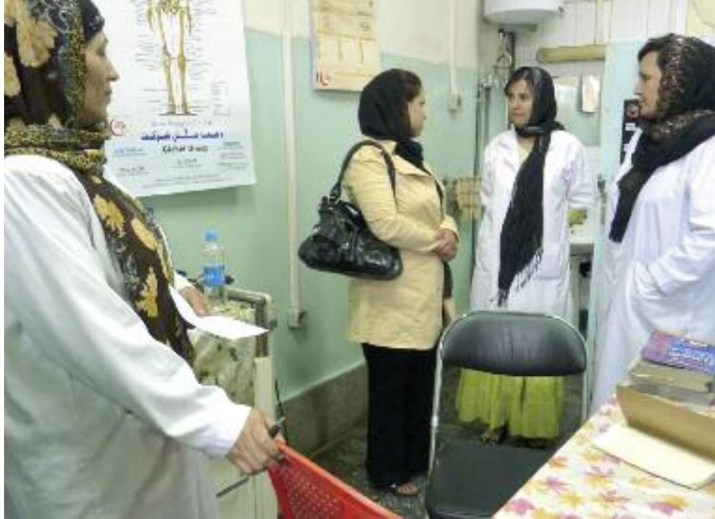
Ärztinnen im Rabia-Balkhi-Krankenhaus beraten sich mit der psychosozialen Beraterin von medica mondiale Afghanistan (zweite von links) zu einem Fall.

Rund ein Jahr lang dauerten die Verhandlungen zwischen Krankenhausleitungen, dem Gesundheitsministerium und medica mondiale – im Mai war es dann so weit: In zwei Krankenhäusern Kabuls gibt es jetzt ausgewiesene Beratungsräume, in denen psychosoziale Beraterinnen und Ärztinnen mit ihren Patientinnen – Frauen, die Gewalt erfahren haben – ungestört und vertraulich reden können: