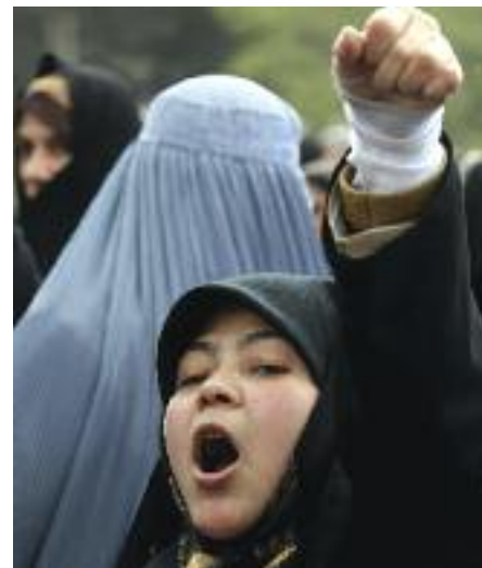
Trotz heftiger Angriffe von Gegendemonstranten ließen sich die Frauen nicht von ihrem Protest abhalten.

für Frauen die Uhr nicht mehr zurückdrehen lässt. Viele wollen sich nicht mehr einschüchtern lassen und sind bereit, für ihre Rechte zu kämpfen und dafür einiges in Kauf zu nehmen. ■