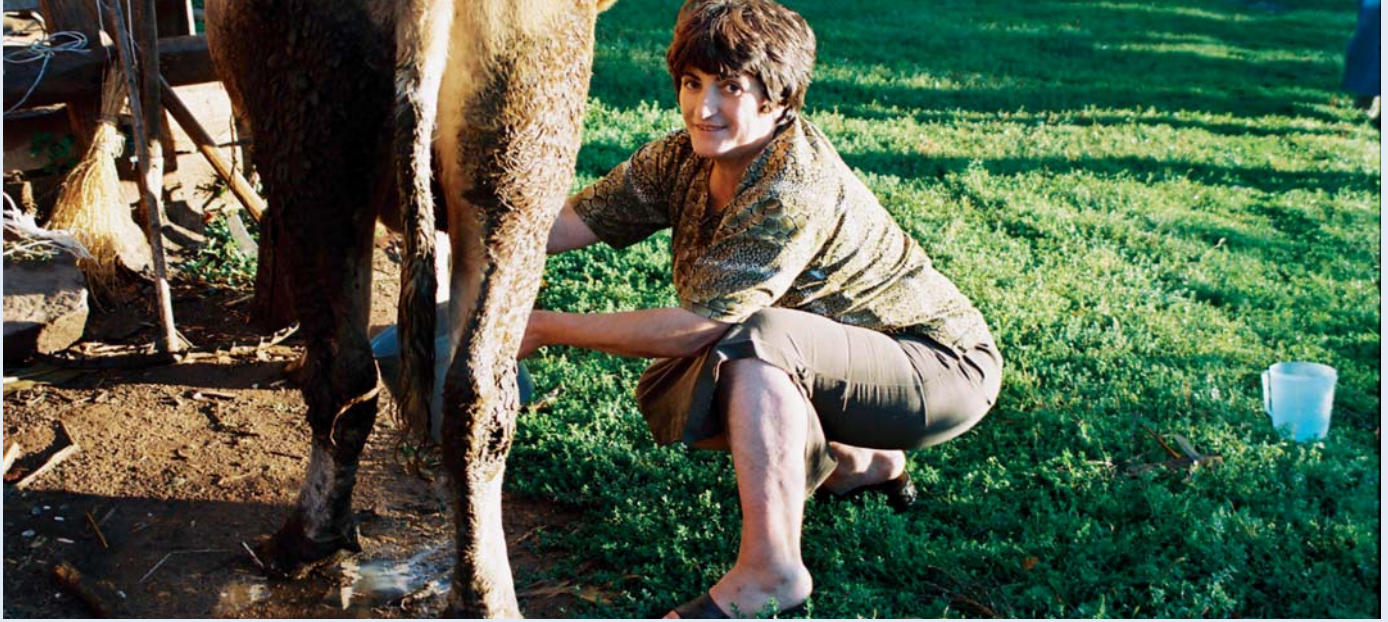
Eine kosovarische Bäuerin mit eigener Kuh in Dobrosh