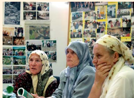
Bosnische Frauen verfolgen den Auftritt von Ex-Serbenführer Karadžić vor dem UN-Tribunal Ende Juli 2008

klärten die AbsenderInnen des Schreibens. Bis zum 29. August, dem Tag des zweiten Erscheinens von Karadžić vor dem Strafgerichtshof in Den Haag, hatte Brammert die angekündigte Neufassung der Anklage nicht vorgelegt. Aus informierten Kreisen war zu hören, dass er die Hunderte von Protestschreiben zur Kenntnis genommen habe und ihm die Anliegen überdeutlich geworden seien.