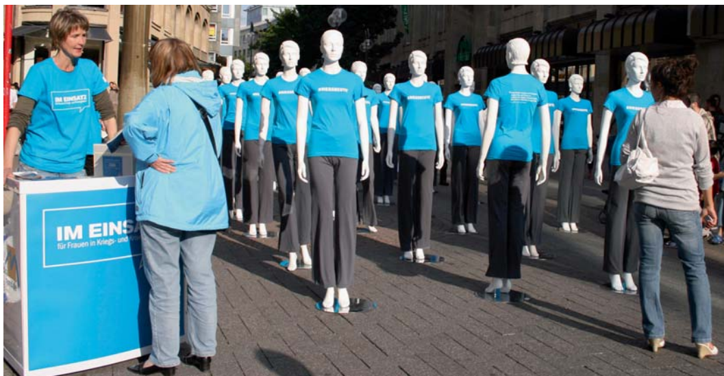
Blickfang auf der Fußgängerzone: 36 Figuren appellieren an die PassantInnen, sich für Frauen einzusetzen

Kampagne „Im Einsatz“ für mehr Unterstützung von medica mondiale gestartet