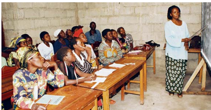
Im neuen Frauenzentrum von PAIF lernen Frauen lesen und schreiben

nen, aber auch, wie sie Kleider nähen, Brote backen, Säfte herstellen und die eigenen Produkte gewinnbringend vermarkten können. Vor allem aber ist das Zentrum eine der wenigen Anlaufstellen für Hunderte Frauen und Mädchen, die im Ostkongo sexualisierte Gewalt erfahren und Hilfe suchen: Die Beraterinnen von PAIF nehmen die Frauen auf und stehen ihnen mit medizinischen und psychosozialen Angeboten zur Seite. ■