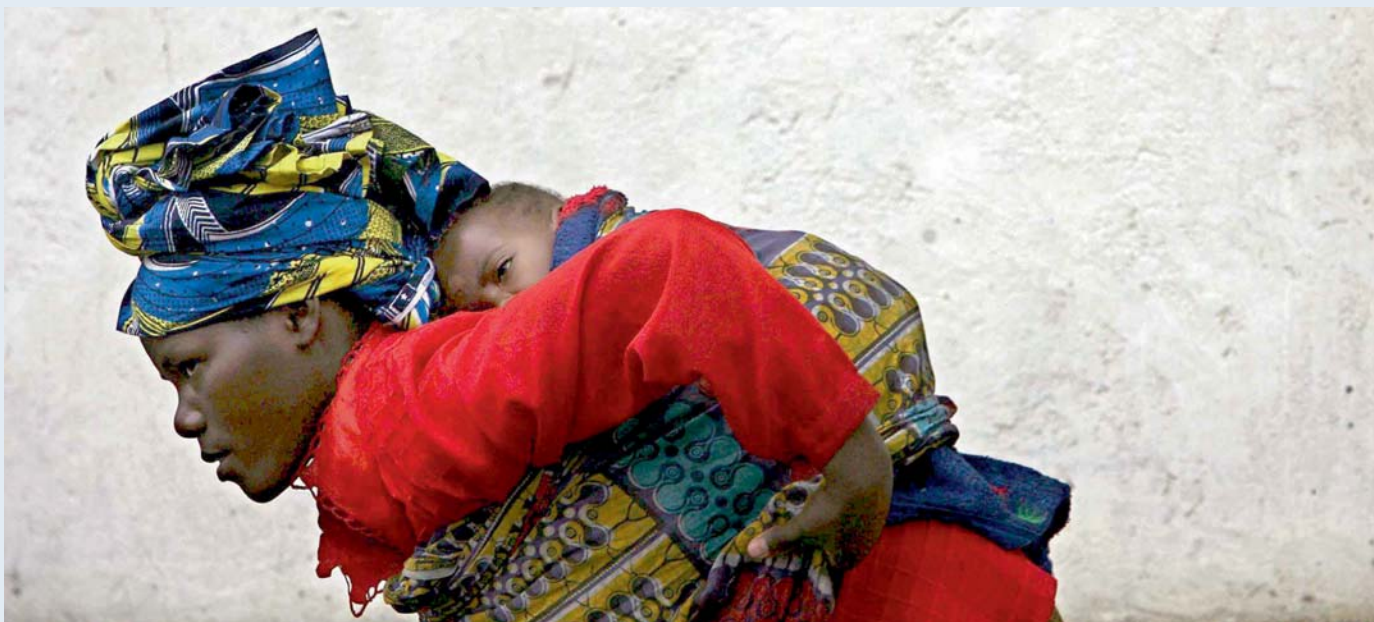
Eine Frau auf dem Weg ins Hospital in Goma