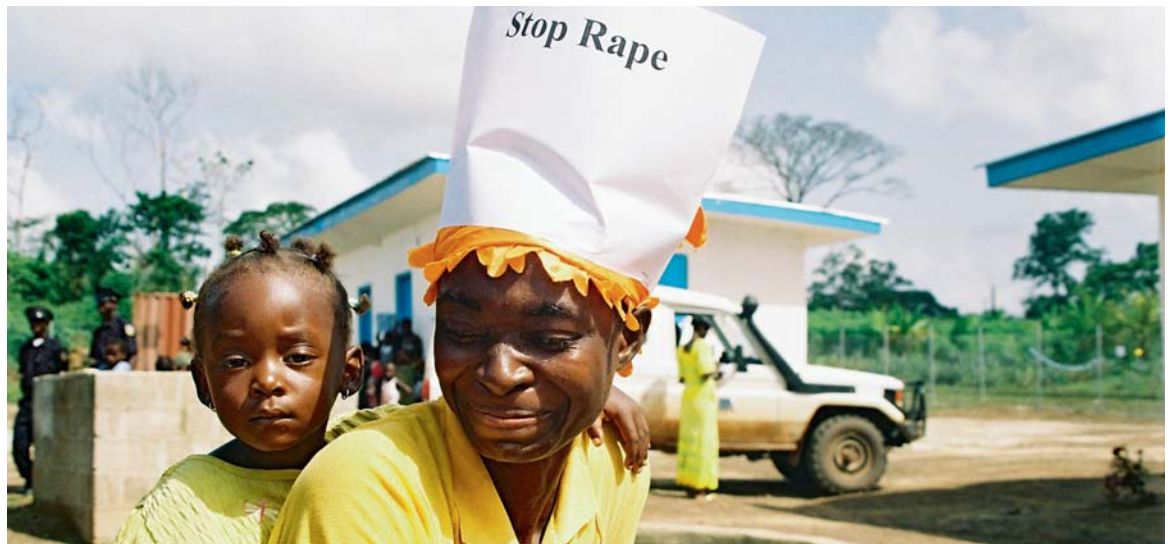
Stopp Vergewaltigungen – eine Liberianerin bei der Eröffnung des Frauenzentrums von medica mondiale in Fishtown

Der Schutz und die Hilfe von Frau zu Frau sind bitter notwendig. Ein Bericht aus Elizabeths Alltag: Victoria ist gerade mal 15 Jahre alt. An einem Nachmittag im September geht sie zu einer Show für Kinder. Die ganze Jugend aus dem Viertel trifft sich dort, es wird getanzt, einige trinken Alkohol.