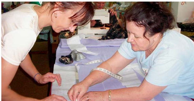
Im Ausbildungszentrum von Medica Zenica lernen Frauen das Schneidern

Die Gehälter der meisten Mitarbeiterinnen können seit Januar nicht mehr bezahlt werden. Medica Zenica arbeitet intensiv daran, Unterstützung auch von den lokalen und nationalen Behörden zu erhalten, doch vor dem Sommer ist mit einer Anschlussfinanzierung nicht zu rechnen. Nun werden 10.000 Euro benötigt, um die laufenden Kosten zu begleichen. Bitte unterstützen Sie uns, damit wir Medica Zenica helfen können! ■