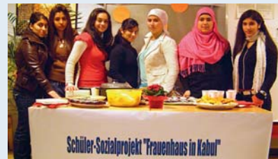
■ Engagement für afghanische Frauen

kauften am Tag der Offenen Tür in der Schule orientalische Speisen. Rund 660 Euro Spenden kamen bisher bei dem Projekt der Mädchen zusammen, die mit Leib und Seele dabei sind. „Es macht ihnen sehr viel Spaß, sich für andere Menschen stark zu machen“, stellt Bita Afshari fest.