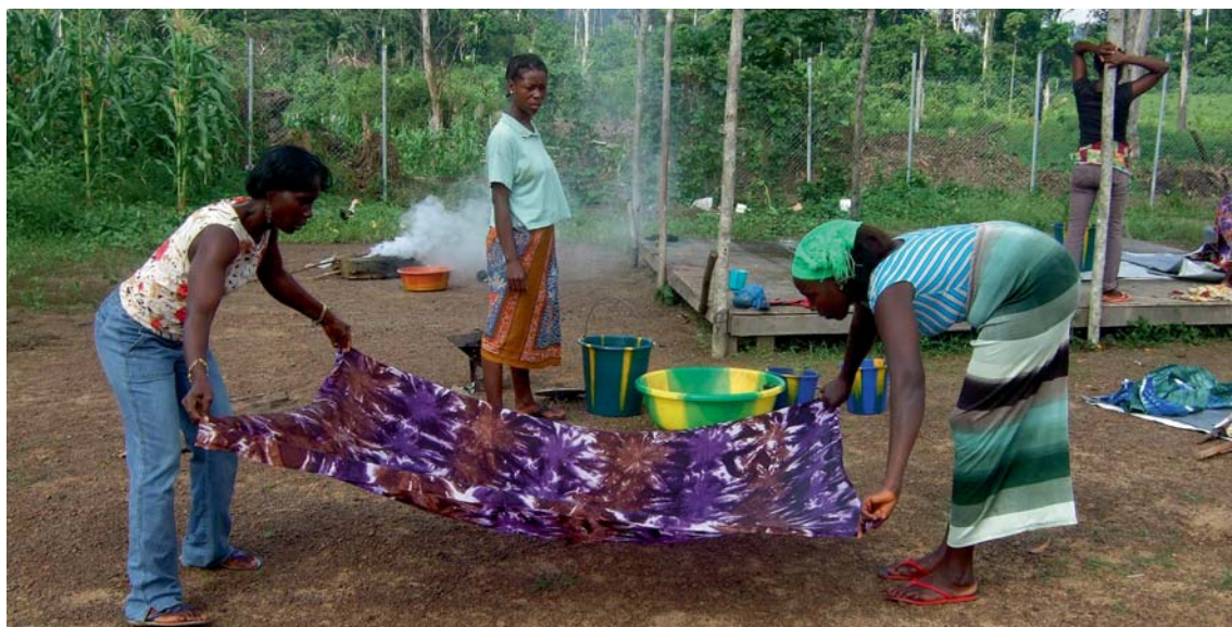
Gefärbte Stoffe werden zum Trocknen ausgebreitet.

Um den Frauen den Einstieg in ihre Kleingewerbe zu ermöglichen, erhalten alle Ab-