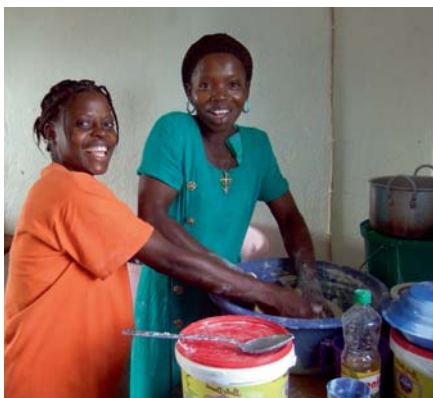
Täglich backen Liberianerinnen Brot im Frauenzentrum, um es anschließend zu verkaufen.

solventinnen zu Beginn Startkapital, das sie nach und nach zurückzahlen müssen. Die Friseurinnen bekommen Scheren, Bürsten und Kunsthaar mit auf den Weg, die Bäckerinnen Schüsseln, Bleche und einen traditionellen Backofen. Die Färberinnen werden mit Stoffen und Farben, die Schneiderinnen mit gemeinschaftlich genutzten Nähmaschinen ausgestattet.