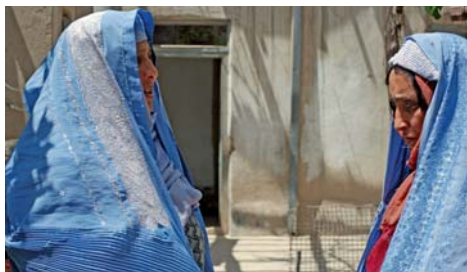
Frauen in Afghanistan erleben oft unvorstellbare Gewalt in ihrem Alltag.

Im Mittelpunkt der afghanischen Aktionen anlässlich der weltweiten Kampagne „16 Tage gegen Gewalt gegen Frauen“ standen im vergangenen November die zahllosen Vergewaltigungen junger Mädchen und Frauen. Zum Auftakt initiierte medica mondiale Afghanistan zusammen mit anderen Organisationen eine Protestaktion mit rund 1.000 TeilnehmerInnen gegen die Freilassung von zwei verurteilten Vergewaltigern durch Präsident Hamid Karsai. Die beiden Täter hatten erst vier Jahre ihrer jeweils insgesamt 16-jährigen Haftstrafe verbüßt. Inoffiziellen Aussagen zufolge unterschrieb Karsai die Freilassungsurkunden vermutlich versehentlich. An zahlreichen Orten in Kabul war der Kampagnenslogan „No Rape, no Violence – Justice and Love“ (keine Vergewaltigung, keine Gewalt – Gerechtigkeit und Liebe) zu lesen: auf Plakaten, Bannern und auf kleinen Spiegeln, die die Mitarbeiterinnen von medica mondiale Afghanistan an Schulen und Universitäten verteilten – der Blick in den Spiegel sollte zum Nachdenken über die eigene Haltung zum Thema Gewalt gegen Frauen anregen. ■