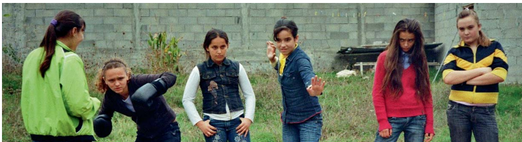
Mädchen aus der Theatergruppe in Tirana lernen, Grenzen zu ziehen.

„Guten Morgen Julia – Warum ich stolz bin, ein Mädchen zu sein“ – so der Titel eines Theaterstücks, das eine Gruppe von Mädchen aus Tirana im Dezember der Öffentlichkeit präsentierte. Knapp ein halbes Jahr hatten sie gebraucht, um dieses Stück unter Anleitung der Theaterpädagogin Christiane Lutz zu entwickeln. Seit Sommer 2007 bietet medica Tirana dieses Selbsterfahrungstraining für